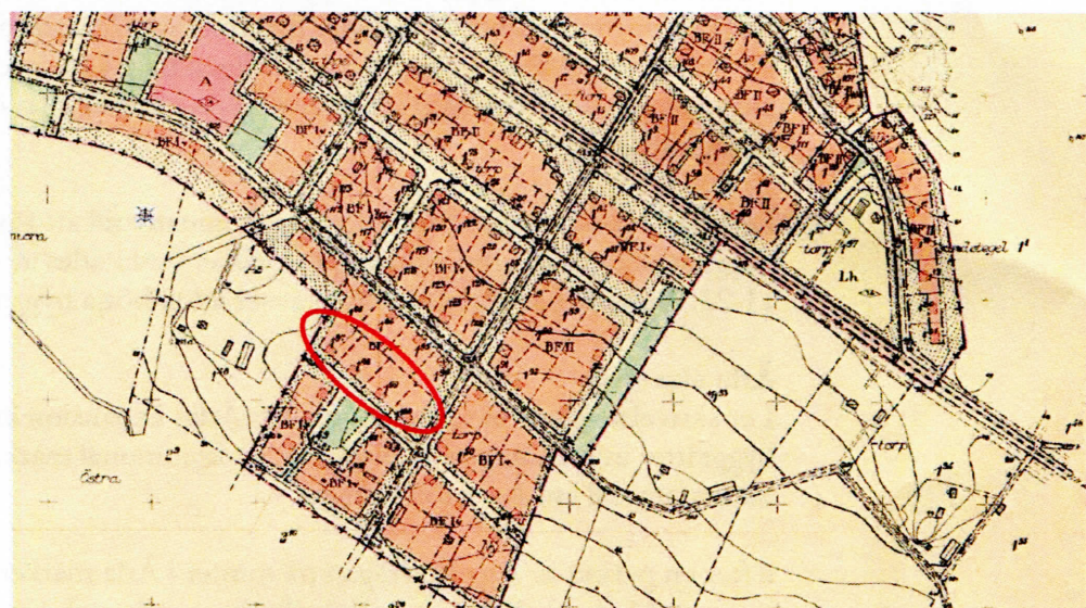
Karta från gällande byggnadsplan. Ringen markerar var byggrätter ligger, som kommer att läggas ut till försäljning.

Postadress Eskilstuna kommun 631 86 Eskilstuna